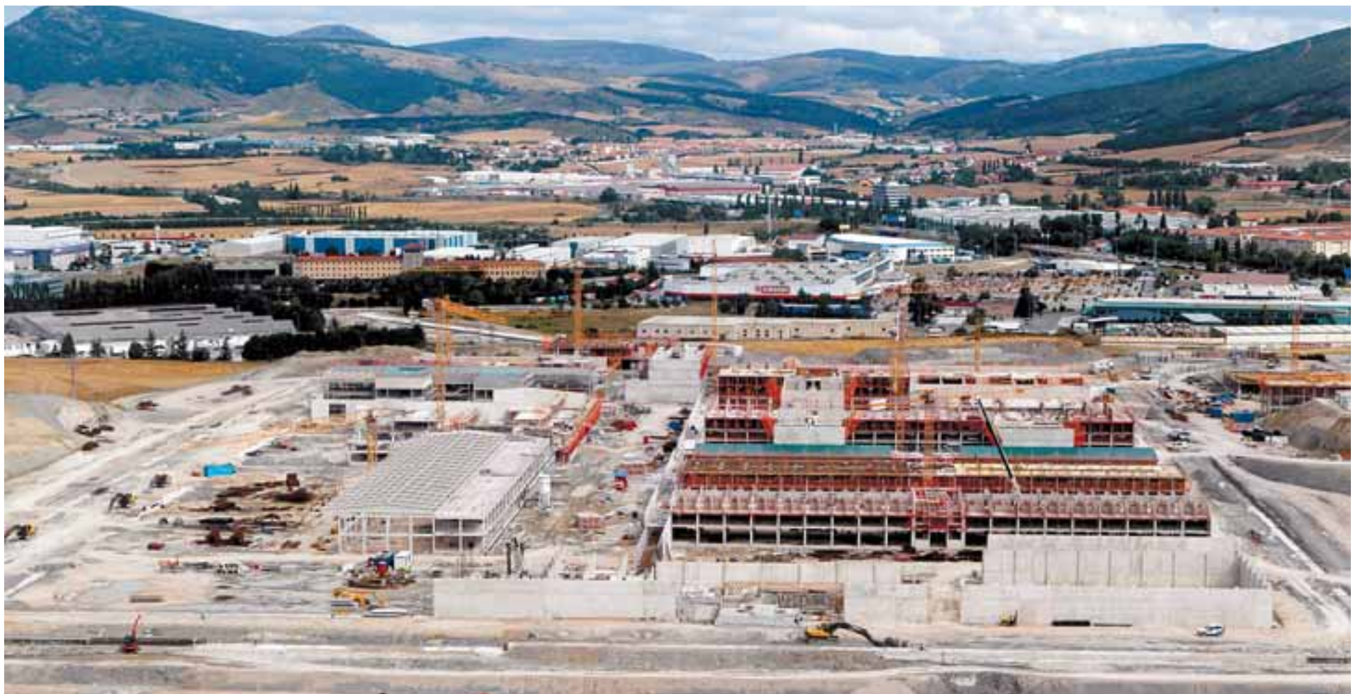
Imagen del complejo de la nueva cárcel; a la derecha se aprecian las celdas y a la izquierda el polideportivo.