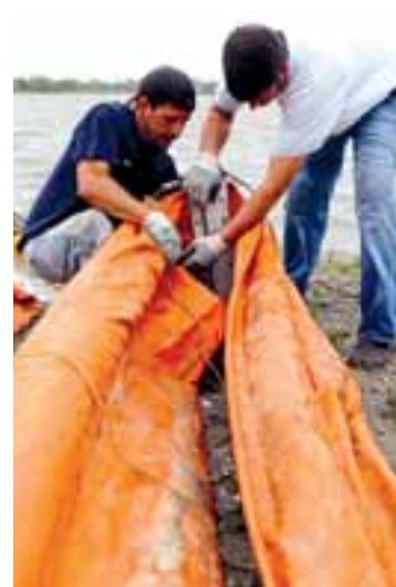
Tareas de limpieza del vertido. EFE

Científicos de EE UU han descubierto el potencial de unas bacterias ocultas en las profundidades marinas para digerir petróleo, que pueden ser vitales en la limpieza del vertido en el Golfo de México, según publica la revista Science . Un grupo de científicos analizó una columna de crudo formada a más de 1.000 metros de profundidad y encontró que la actividad microbiana, encabezada por una nueva especie sin clasificar, está degradando el petróleo. EFE