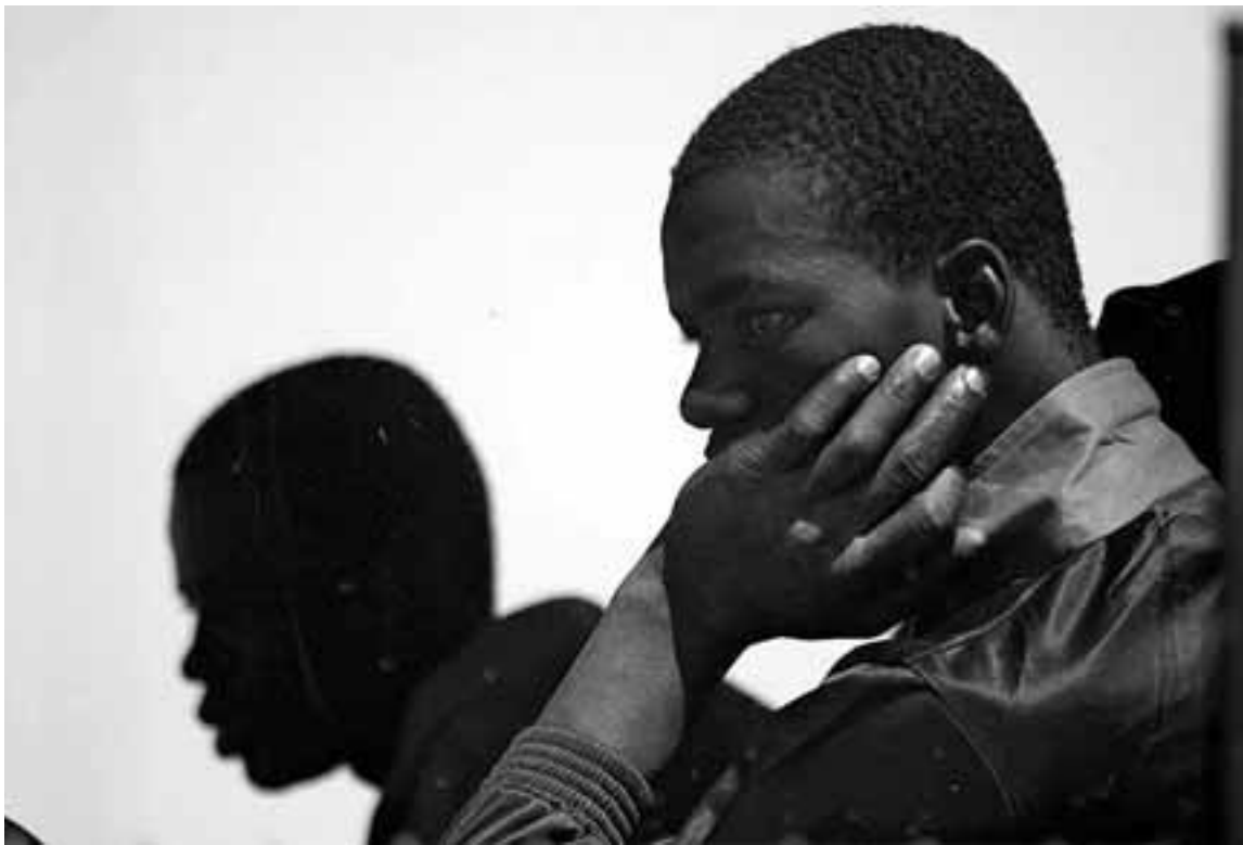
Un inmigrante subsahariano, con la mirada perdida.